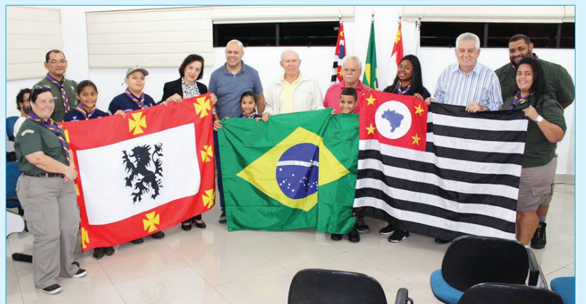
Grupo Escoteiro do Ar São Vicente 234SP