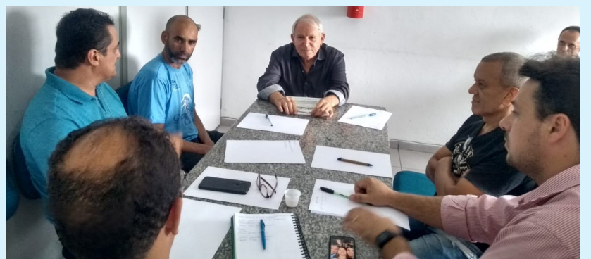
Presidente quer uma participação efetiva dos empresários da Região

na subsede da Área Continental para gerar mais oportunidades, eventos e muitos negócios.