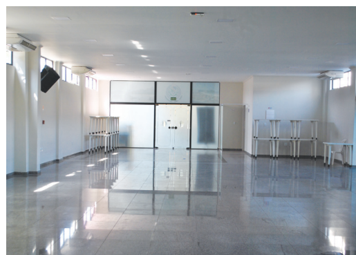
A capacidade de lotação é de 300 pessoas. A Associação possui mesas, cadeiras, telão e projetor