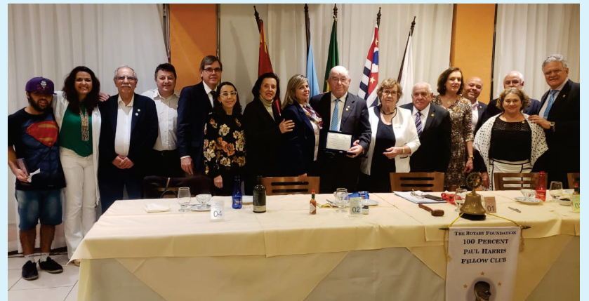
Evento aconteceu no Restaurante Terraço